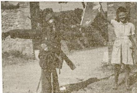
Jauna francūzaitė rodo pavyzdį "gero vokiečio." Jos nuomone, geras vokiečių tėra tik negyvas. Dėlto ji prikimo šiaudais nacių uniformą ir į rankas įdėjo baltą vėliuką, kaip ženklą visuotinio pasidavimo.