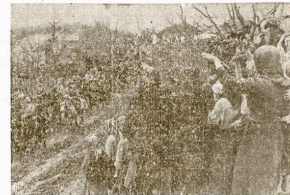
Mintos rumunų pakelėse sveikina įmaršuojančius Dono kazokus. Rumunijoj, kaip ir Bulgarijoj, nacių okupacija jau ištaškta. Rumunų kartuomenė dabar kausis prieš nacius Transilvanijoj ir jau yra peržengė Vengrijos rubežius.

Apie pavartojimą bangų kiek sunkėnis dalykas, bet ir tą galėtų pritaikyti per tam tikrus sparnus, kuriuos bangos vartytų ir duotų energiją.