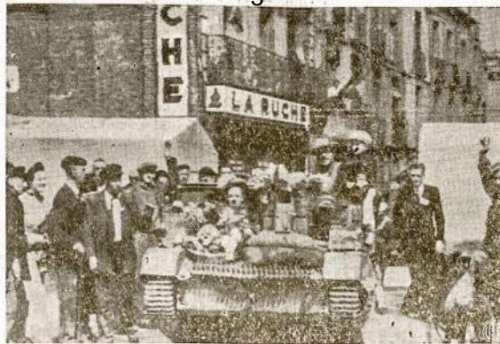
Dieppe piliečiai, Prancūzijoje, demonstratyviai pasitinka Taktininkų tankų koloną savo miesto gatvėse. Prancūzai netik apdovanojo tankistus bučkiais, bet padabino jų tankus gėlių vainikais.