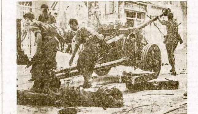
Francūzai atsiteliesina apverstą nacių kanuolę Toulon mieste ir su ja tuoj apaudė dar nesėpėjusius pasitraukti hitlerininkus. Priekyje matosi nacio kanuolninko lėtvonas.