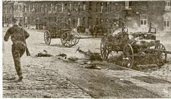
Nacių palikti arkliais traukiami vežimai Belgijoje, kada Talkininkų armijos juos iš ten išvyjo. Nacių naudojamasis tokiais vežimais karo fronte išaikinamas stoka gasolino motorizuotam transportui.

Šio mėnesio 16-tą buvo labai didelis gaisras. Užsidedę muilo įmonė, 808 Denison