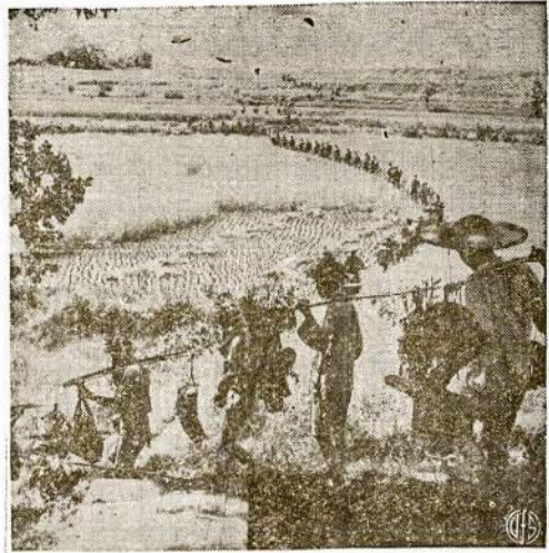
FOOT TOTE—Carrying their equipment strung from bamboo poles instead of in knapsacks, Chinese warriors tramp single file across countryside. Soldiers are moving into position for attack on a Japanese stronghold near Hengyang, China.