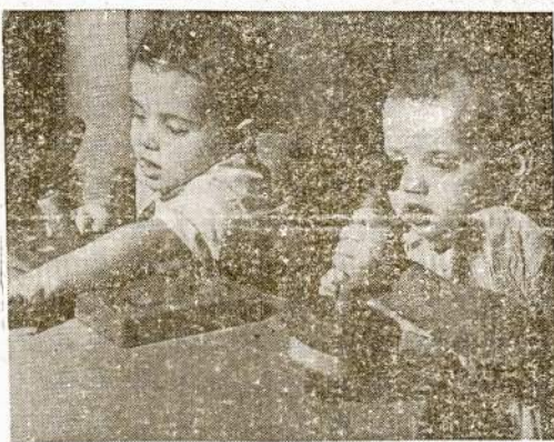
"MEN", MUST WORK— and mothers, too, in war times. Meanwhile, children are kept busy, happy and healthy in a safe nursery.