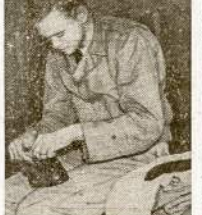
Amerikietis žūrininkas Skotijoj išsigelbėjęs nuo paskandinimo laivo. Čia jis draugiškai priimtas ir jam suteikiama draubūzia ir apavai.

LONDONAS. — Graikijos premieras George Papandreu skelbia, jog Graikijos Išlaisvinimo valandą jau yra visai arti. Naciai bus tuojau išyti iš Graikijos.