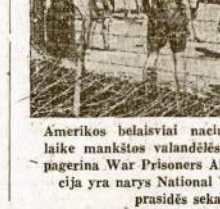
Amerikos belaisviai nacių koncentracijos stovyklose laike mankštos valandėms. Belaisvių būklė šiek tiek pagerina War Prisoners Aid organizacija. Ši organizacija yra narys National War Fund, kurio rinkliava prasidės sekančią pirmadienį.

Taigi, ir mes, kubiečiai, neatsilikame nuo Jungtinių Valstijų lietuvių, nors mūsų skaičius labai mažas. Habanos Lietuvis.