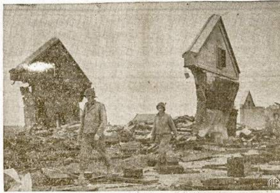
Šioj vietoj buvo nacių amunicijos sandėlis. Kaip matyti, mūsiškių artilerijos sūvis puštinai gerai pataikė, nes netik amunicijos nebeliko, bet ir paties sandėlio tik dalis sienos tebestovė. Paveiktas nutruktas francūzų-vokiečių pasienyje, Metz srityje.

Unijos konvencija vėl patvirtino pažadą nestrėikuoti laike karo.