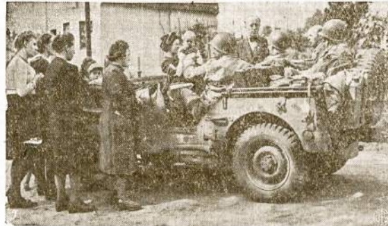
Būrys vokiečių kaimiečių apstoje amerikiečių "Jeeps" sveltina išvaduojuos iš nacių vergijos. Tuoj po tam nacių vyriausybė paskelbė hausiant mirim visus, kurie rodys džiaugsmo sutikdami Talkininkų armijas. Nėra abejonės, kad jie taip ir padarytų, jei po šiam karui pasilikų galioje.