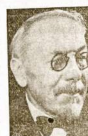
Jules Jeanneney, francūzų valstybės ministeris laikinojį Francūzijos vyriausybėj.