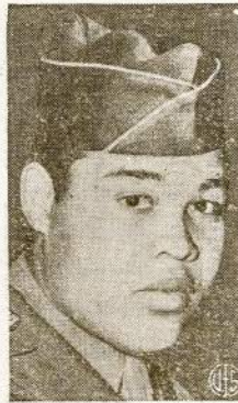
RETURNS —World's heavy-weight champion, Sgt. Joe Louis Barrow, as he looked on arrival in New York after six-month air tour of GI bases in the European and North African theaters. Nearing the end of his third year in service, he said he was 10 pounds heavier than his fighting weight of around 205.

One million copies of textbooks in the Uzbek and Russian languages have been issued by the State Publishing House of the Uzbek Soviet Republic. An English grammar is also being published.