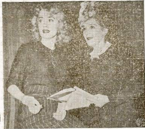
CRY HAVOC —Little sister June Havoc (Gypsy Rose Lee's) has taken role of Sadie Thompson in forthcoming production of Somerset Maugham's "Rain," which will open on Broadway as a musical. Miss Havoc is just back from Hollywood, where it is reported she slept in a pup tent in a friend's backyard because of housing shortage. Here she is reading script with Mary Pickford, who is one of the show's backers. And those are wishbones on Miss Havoc's blouse.

I agree that as a presidential possibility Dewey is preposterous and that his election would be a calamity, which, happily, does not seem imminent. He just isn't enough man for the job of President.—Westbrook Pegler in World Telegram of June 17, 1940.