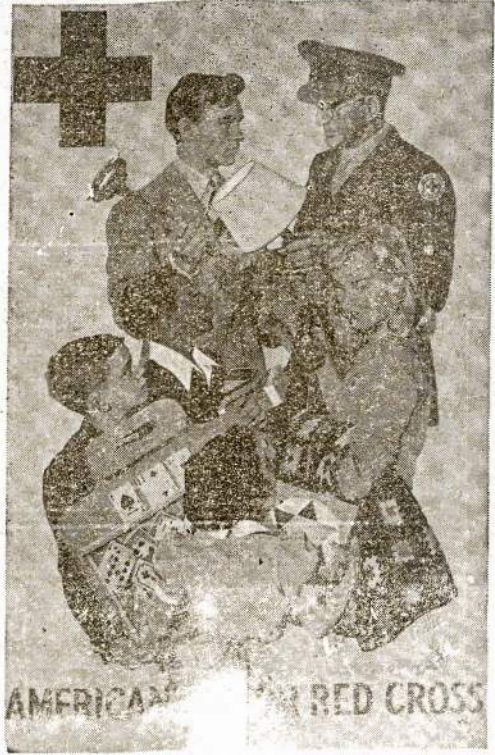
More than 13 million Junior Red Cross members are turning out articles for the armed forces among 45,000 Red Cross chapters in this new 1944 Enrollment for Service poster by the artist Al Parker

Registration for the Nation's first peacetime service draft started on Oct. 16, 1940. Since then more than 22,000,000 men have registered and more than half have been inducted into the armed services.