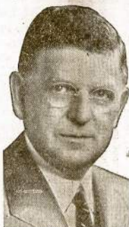
Major Edward J. Kelly Majoras Kelly

Šios savaitės pradžioje E. J. Kelly buvo sukviestas veikėjus, kurie stoja už Rooseveltą išrinkimą 4-tam terminui, pasitarti apie surengimą masinio mitingo Rooseveltui.