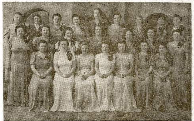
CICERO MOTERŲ CHORAS