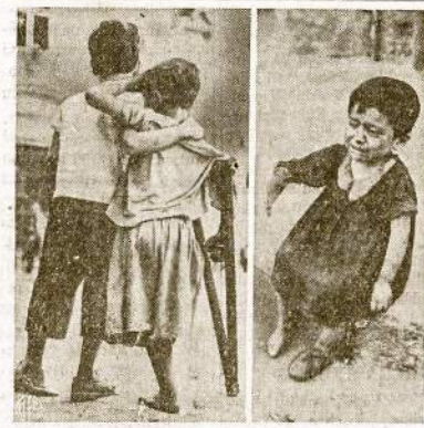
Jem pagelba reikalinga kuoskubianisju laiku. Štai keli italy našlaičiai, nufotografuoti Neapolyje. Jie neteko namų ir globėjų. Vieno kojukė nutraukta nacių bombos. Tokių našlaičių kūdikijų liko šimtai tūkstančių kur tik nacių karo mašina praužė.

STOCKHOLM. — Pabėgęs iš Vokietijos serzantas pasakoja, kad šiaurinės Vokietijos miestuose antinacianai pradeda smarkiau veikti. Hamburge, Lubecke, Kiele ir Bremene suorganizuota slaptoji unijistų grupė. Vokiečių liaudis nori taikos bilye kokią kainą.