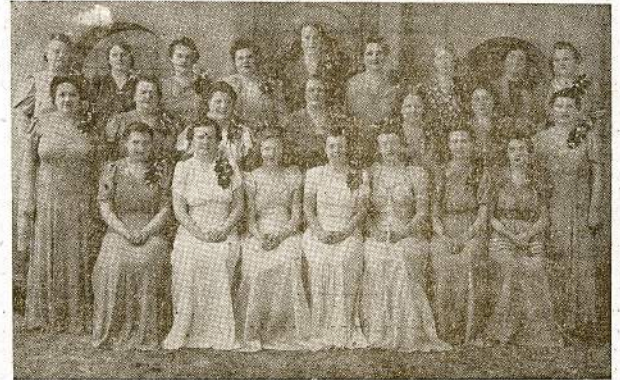
CICERO MOTERŲ CHORAS