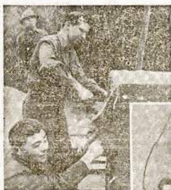
CHUNGKING — What it means to have music in far away Chungking where a piano costs anywhere from 100,000 to 200,000 Chinese dollars if it can be had at all, only these G.I.'s know.

For a long time afterward charred bodies were exhumed