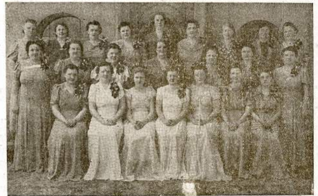
CICERO MOTERŲ CHORAS