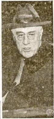
Franklin D. Roosevelt

Programas Nuo 3:30 Popiet; Šokiai iki Vėlumos Programo Pildyme Dalyvaus Pasizymėje Talentai, Choral Ir Čigoniškos Muzikos Grupė