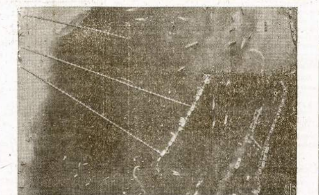
Si fotografija nutraukta iš lėktuvo parodo ant greitųjų Tarkininkų pagamintą prieplauką prie Francūzijos krantų. Darant invaziją Francūzjon Tarkininkai nenaudojo jau esamas prieplaukas, kur naciai tikėjosi, bet atsivėrė iš Anglijos gatavai pagamintus pliceno smotus ir ant greitųjų sudėję pasidarė net dvitokias prieplaukas, kur išlaipino kariavus ir iškėlė karo būkulus.