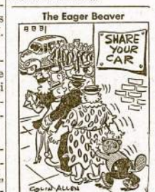
The Egger Beaver

Su juo buvo ir žmona. Ji išliko nesužeista. Repholz nuvežtas į ligoninę buvo paskelbtas mirusiu.