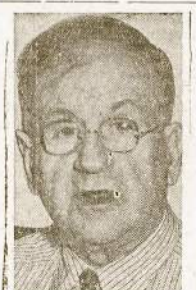
Vidaus reikalų sekretorius Harold L. Ickes. Rašė užsibaigusios rinkimieje kampanijoje šis bene geriausias namaskavo republikonų reakcinis kandidatas.