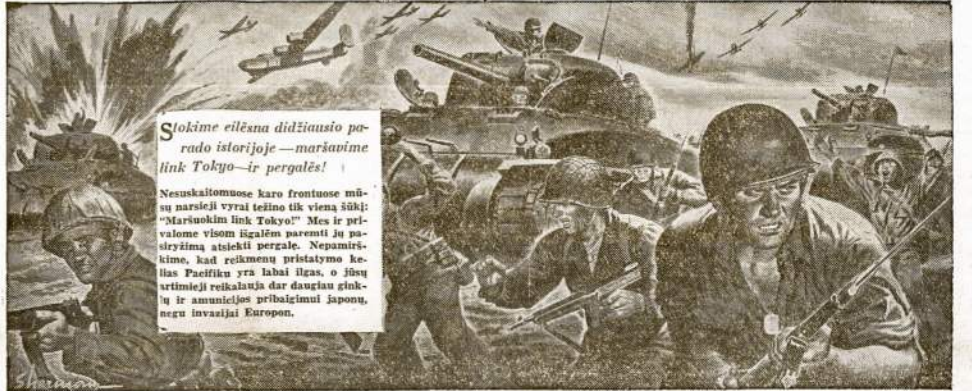
Stokime eilėna didžiausio parad istorijoje — marksimine link Tokyo — ir pergalės!

Nesuskaitomose karo frontuose mūsų narsieji vyrai težio tik vieną šūkį: "Marsuokim link Tokyo!" Mes ir privalome visom išgalėm paremti jų pasiryžimą atsiekti pergalę. Nepamirškime, kad reikmenų pristatymo kelias Pacifikui yra labai ilgas, o mūsų artimieji reikalauja dar daugiau pinigų ir amunicijos pribaišimui japonų, negu invazijai Europon.