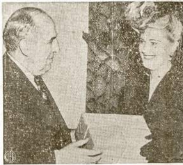
Metropolitan Operos dainininkė Helen Jepson priduo savo kalėdines dovanas New Yorko miesto viršiniukui ankstyvam pasiuntimui. Pašto viršiniukai visur prašiliočius, ypatingai šmet, anksiti siųsti kalėdines dova-nas, nes karo metu pašto pareigūnai ir be to užversti darbais.

Individualiai asmenys jau iš-pirko karo bonų už $600,000,000.