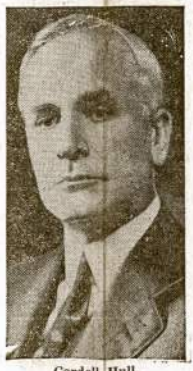
Cordell Hull. Einant "Vilnijai" spaudon, gauta žinia, kad prezidentas Rooseveltas nominavo valstybės sekretorium dabartinį pasekretorių Edward Stettinius.

Edward R. Stettinius Valstybės Sekretorium.