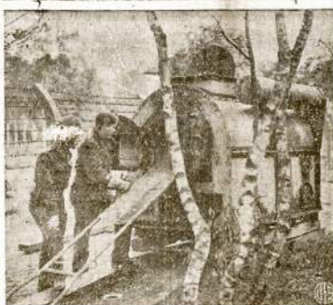
Britų kareiviai žiūri į nacių paliktą plieninį kagalį Olandijoje. Šioj vietoj buvo belaisvių koncentracijos stovykla. Nužudytų belaisvių lavonus naciai degino šiame kagalyje. Apskačiuota, kad tik šioj vienoj vietoj sudėginta virš 13,000 nekaltų žmonių.

Nuo dabar iki gruodžio 16 investuokite kiekvieną atliekamą dolerį į Karo Bonus. Reikia sukelti $14,000,000, kad užtikrinti pilną pergalę prieš asies barbarus.