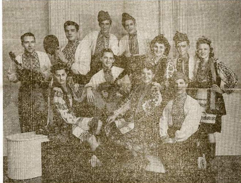
UKRAINIAN FOLK DANCERS