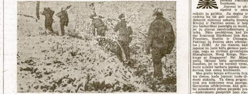
Grupė amerikiečių pėstininkų eina artyn fronto linijos Francūzijoje. Tame sektoriuje jau žiema ir žemė storai apklota sniegu.

resnių valdžioj reformų, o tuomet kinai geriau galės kariuoti prieš Japoniją. Jei Ciangas to nedarys, jis vargiai galės pasilaikyti Kinijos valdžioj po karo.