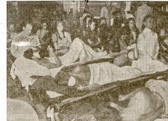
Dalis katedros Leyte saloje, Filipinuose, dabar naudojama kaip ligoninė sužeistiems kariams. Čia matosi ankstyvi parapižiniai beklauks mišų, kai slaugės ir gydytojai aprūpin sužeistuosius medikamentais.