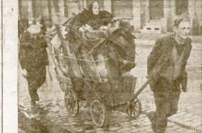
Vokietukas sugryžta namo į Metza ir ant ratukų parsiveža savo senolę. Civiliai buvo išbėgioję į miškus kai tą miestą Talkininkų armijos šturmas.

Patys nešioti pirkinjus. Neužmirškite šeštojo Karo Paskolos Vajaus. Karo bondsai ir stampos yra geriausia Kalėdų dovana. Cia gali prisidėti ir moksleiviai, keliaudami namo prieš prasidedant vakarinei skubos valandai.