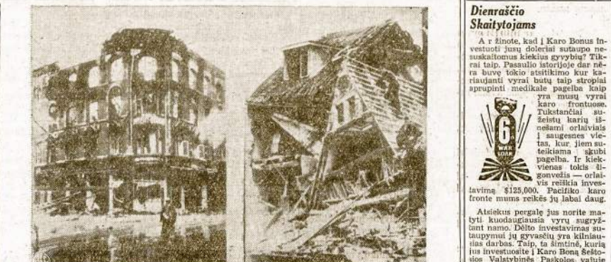
Nacių sunaikintas Danijos miestelis Aarchus. Sunaikintas jis iš keršto, nes tame miestelyje danai partizanai išsprogdino kiek pirmians nacių gestapininkų lizdą, kur sunaikintais virš 100 hitlerininkų budelių.

Ligonis po operacijai: "Klausyk, daktare... Ištikrųjų įspėjai užtikrinamas, jogei aš vaikščiošiu už trijų savaičių po operacijos!" Daktaras: "Puiku, ar ne?" Ligonis: "Aš priverštas būvau parduoti savo automobilių, idant užmokėjus Jūsų prišūsta lila..."