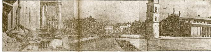
Gedemino Alkė Lietuvos sostinėj Vilniuj. Bažnyčia su trimis stovylomis ant stogo yra katedra labai senai statyta. Priešais ją vėrpinyčia. Kai kurie namai matyti stovi nesugriauti.

Kaip apie tai pasakys Chicago artistai? L. Prėseika.