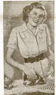
Selmininkės džiaugsis atsiekus pergalę prieš fašistinę ašį, ir nebereikalo. Štai pokarinis prosas. Nebereikės narplioti ir mezzioti ilgas elektriskines vietas. Prosas įkais visat be viely.

Anksčiausia kę velykos gali pripuili yra kovo 22, o vėliausia balandžio 25. Vėlybiausias velykas turėjome 1943 metais (balandžio 25), o anksčiausias buvo 1818 (kovo 22). 1845, 1858 ir 1913 velykos pripuolė kovo 22.