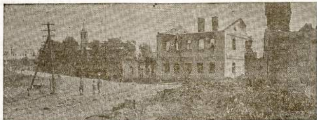
Litėdas vaizdas liko kai naciai iš Lietuvos buvo išstrenkti. Čia matosi Adutiškio miestelis. Traukdamiesi vokičiai viską naikino.