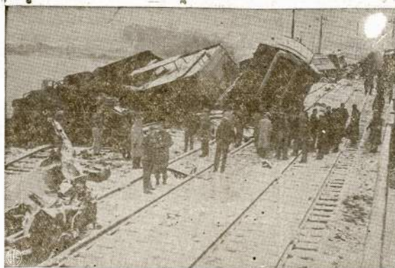
Trys traukiniai nusivertė nuo bėgių vienoj vietoj, netoli mūsų šalies sostinės Washington. Tai buvo anądien, kada tą aplėnikę nuklojo pirmas šio sezono sniegas. Du traukiniai buvo prekiniai, o vienas keleivinis. Katastrofoj vienas traukinio inžinierius užmuštas, 12 keleivių ir įgulos narių sužeista.

Svarstant Tarybų Sąjungos biudžetą, iš deputatų pranešimų, iš tuose pranešimuose minimų milijardinių sumų prieš mūsų akis visu ryškumu išliko Tarybų Sąjungos didieji ūkiniai ir kultūriniai laimėjimai, nepalaužiamas pa-