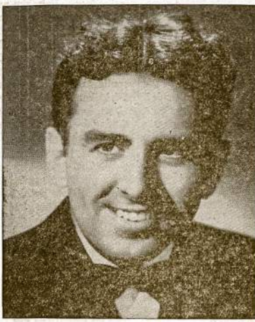
Linksmų Kalėdų ir Geresnių Naujų Metų

Būk velnias sužinojęs, kad Jezus ateis ant žemės ir įsteigs religiją, tai velnias pasiskubino (kitaip sakant, užbėgo dievo sūniui už (Tąsa ant 6-to pusl.)