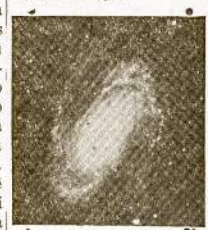
Išlaukinė nebula, besilaikanti link mūsų pakrypusi dalinai kraštu.

kam šie nebulų tolinimosi greičiai sudaro didelį galvoskaušį. Ar tatau galima? Ar mūsų iki šiol turimos priemonės ir būdai tam patirt mūs neapgauna, ar ne sudaro iliuzijos?