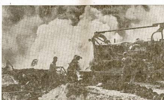
Karo frontuose ugniaegis komandos yra vienas svarbiausių dalynių. Priešas, kaip matosi iš šios fotografijos, daugiausia stengiasi padegti amunicijos ir gasolino sandėlius. Tą bandė japonai Saipane saloje. Bet mūsų ugniaegis greitai gaisrą likvidavo ir apsaugojo brangią karinę medžiagą nuo sunaikinimo.

Jau tik į didelius stebuklus tikinti gali tikėti, kad tretinė lenkų valdžia galės daugiau ką daryti kaip paplepti.