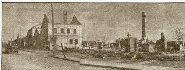
Svenčių miestas ką tik iš jo išstrenkus nacius. Mažai čia beliko sveikų pastatų kai pirm pasitraukiant naciai viską sistemčiai naikino. (Liet. Pagelbos Teikimo Komitetas.)

Pirkite ekstrą Karo Boną ant Kalėdų savo giminėms, kurie tarnauja Dėdei Samui.