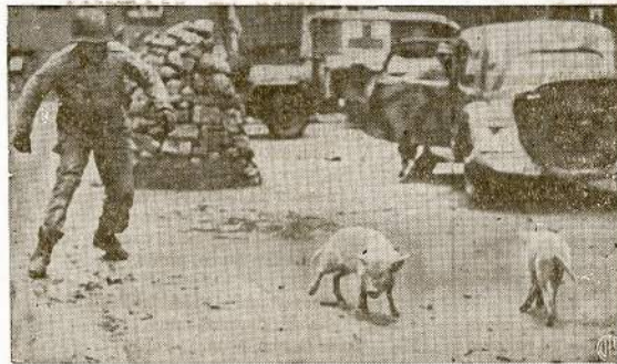
Nežinome kas šis amerikietis kareivis, bet iš atvaizduotos aplinkumos nesunku atspėti, kad jis neužlogo valgyti šviežios kiaulienos kepsnį. Pavėikslas nutrauktas mūsų kariuomenės užėmus vokiečių miestą Metz.

Gavo Daug Rusiškai-Lietuviškų Žodynelių Vilniuje gauta iš Valstybinės Leidyklos Maskvoje didesnis kiekis rusiškai-lietuviškų žodynelių, kurie paravinėjami Spaudos Sąjungos krautuvėje Nr. 1, Gedimino gat. 23. Žodynelis mažo formato, turi apie 15 tūkstančių žodžių. Kaina 5.50 rb. (tr)