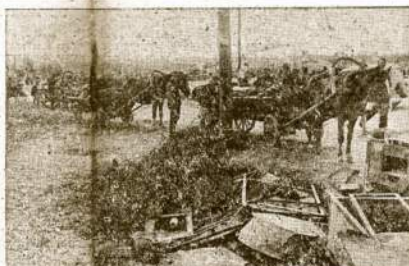
Slapstęsi nuo vokiečių miškuose, Lietuvos žmonės grįžta namo. Sulaukė jie valandos, kada vėl gali didžiūtiis savo mylimuoju kraštu.

CHUNGKING, gr. 22.—Kinijos armija trim punktais puola gelžkelio centrą Hochsch, šiaurvakarinėj daly Kwangsi provincijos. Kinai sako, japonai gavo rezervų ir stengiasi atsilaukyti, nes tai svarbus gelžkelio punktas.