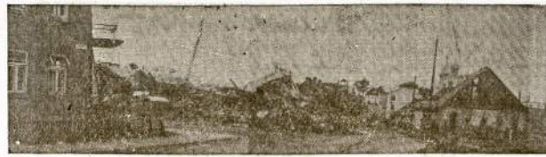
Pastovių miestelis. Vokiečių sugriautas kino teatras.

Klerikalų ir socialfašistų "meilė Lietuvos" tiek tereikiška, kiek jie gali iš patriotizmo turėti ypatingos naudos. Jei netiesia, paklauskite jų kiek jie jau yra pasituntę aukų nacių nutorietams lietuviams. O juk jie yra geriausi kolektoeriai ir "Lietuvos pagalbai" turi surinkę nemažai.