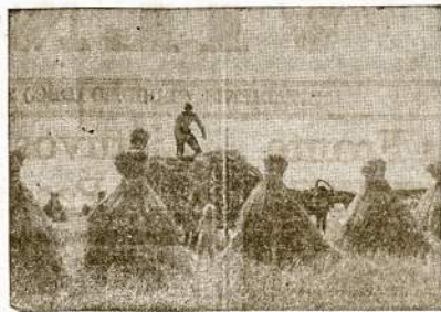
Kur vokičiams dėl skubaus nešdinimosi iš Lietuvos nepasisekė viską sunaikinti, kaimiečiai suima derlių nuo laukų. Vakaruose dar girdisi kanuolių dundės, bet kryžiuočiai ainiai Lietuvon daugiau nebeegryž.

—Aš jau senas. Man neilgai beliko gyventi. Bet aš dirbsiu kaip jaunas, dirbsiu už du, už tris. Nors dalele savo darbo ir aš prisidėsiu prie didžios pergalės nukalimo. Vokičiai norėjo kombi-