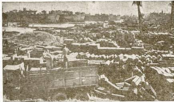
Štai kodėl mes privalome pirkti daugiau ir daugiau karo bony. Šiame atvaizde matosi tik viena prieplauka Leyte saloje, Filipinuose. Kiek akys užmato nuklota amunicija ir kitokiame karo reikmenim. O be to japonų neisprašyti iš jų okupuotų teritorijų. Amunicija, ginklai ir pristatymas—išsuoja nesuskaitomus milijonus dolerių.

Senai galvota ir apie tai daug kalbėta, kad reikia ten pradėti gydyti ligą, kur ji atsiranda. Vietoj daktarui sėdėti kabinete ir laukti iki liginis ateis skystis kokių nors negerumu, tai naujovinė visuomenė visai kitaip dalyką pastatys: parūpins, kad žmones egzaminuotų darbo pareigose ir juos ten pat imtų gydyti prasidėjus kokiame nors negerumui. Sovietų Sąjunga pradėjo steigti sanatorijas prie dirbtuvių. Vienos sanatorijos yra naktinių, o kitos dienninių pakaity. Laikė šio karo per visą Sovietų Sąjungą liko atidaryta 100 naktinių sanatorijų. Zinoma, tik pradžia apie tą didį ir džiuginančios reikšmės dalyką. Z. Ivanovą rašo: Nesenai atsiradę naktinės sanatorijos šimto lovų Uralo mašinių fabrike; tapo pastatyti namai naktinei sanatorijai, su 120 vietų įtalpos Magnitogorsko įmonėje. Į šias naktines sanatorijas darbininkai užėina tuojau po darbo ir ten išbūna iki rytojaus. Su tuo spaudove pranešimu prisiminiau mano tik ką atliktą apsilankymą vienoje tų sanatorijų, atidarytoje greta didelės karo išdirbinių įmonės, ir nutariau apie ją atspasakoti korespondencijoje. Aplankiau šį poilsio namą, nes daugelis man apie jį kalbėjo. Įmonės profsąjungos komitete mane painformavo, jog naktinė sanatorija išlaikoma socialės apdraudžios lėšomis ir kad ji jau gyvuoja virš metų laiko. Per šį laikotarpį išėjosi ir išsigydyd nepasitraukiant iš darbo, arti tūkstančių darbininkų. Paprasčiau, kad parodytų sanatoriją. Įmonės profsąjungos komitetas paskyrė