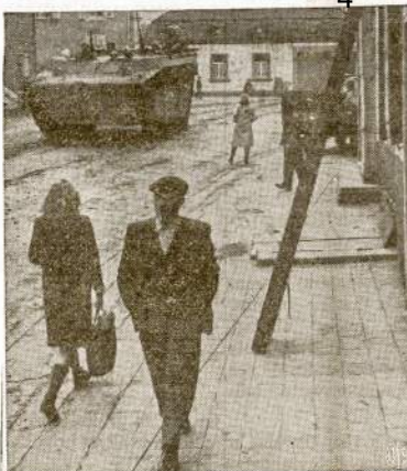
Amerikos "plaukiojanti sunkvežimiai" kėlik iširėti ir sauszemj Vokietijos mieste Saarlautern. Militarinės načių jėgos iš miesto jau pasitraukusios, o civiliai, kaip matosi, vaikščioja sau lyg niekur nieko.