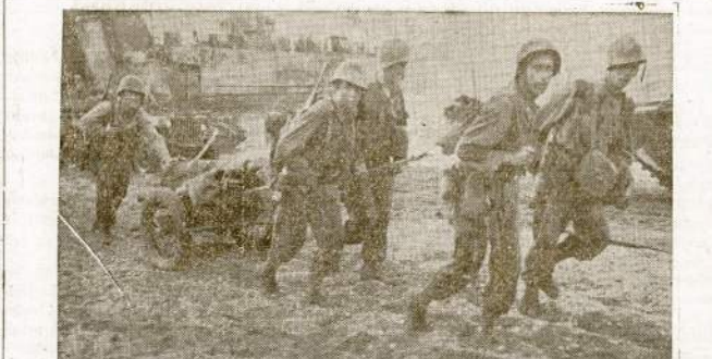
Būrys jankių velkasi mirtinas ir kitokius sunkius ginklus į naujas pozicijas, kada šioj vietoj Leyte saloj jiem pasisekė sunaikinti japonų pasipriešinimą. Šiuom laiku sala jau visiškai apvalyta nuo japonų ir mūsų jėgos persikėlė kiton salon, Filipinuose.