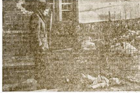
Amerikiečiai kareivis su pasipiktinimu žiūri į lavoną 6 metų berniuko, kurį nacių nusiėvė tik dėlo, kad berniukas išsigaudo ir pradėjęs balsai verkti. Tokių lavonų rasta daugybės, kai amerikiečiai ištrenkė nacių barbarus iš Stavelot apeliėnkės, Belgijoje.

STOCKHOLM, sausio 11. — Anglijos orlaiviai atkavo Vokietijos laivų konvojų ir naikina 7 laivus muskandino, sako Norvegijos legacija.