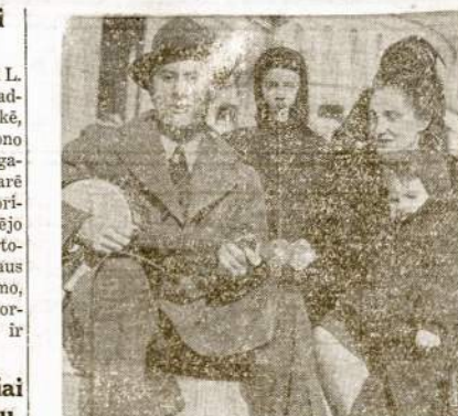
Senatorius Glen H. Taylor, iš Idaho, atvykęs Washingtono su šeima apsižiūrėjo, kad negali gauti kambarių apsigyvenimui. Tad jis atsisėdo ant kongreso rūmų trepų ir uždainavo "Give me a home near Capitol Dome." Su senatorium sėdi jo žmona ir du vaikai.