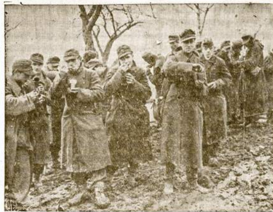
Čielas būrys Hitlerio "supermenų" kurnors Abasijoje valgo pirmą karštą maistą kelin-tą dieną po suėmimo nelaisvėn. Iki hitlerininkai nuvaromi toleka už fronto jiems prieš-eina pastenktinti užkandus tik šaltą "K" porciją.