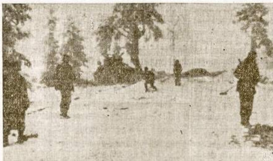
Amerikiečiai kareiviai atsargiai žingsniuoja Hurtgen miškais, Vokietijoje. Sniegu nukloti keliai ir takeliai bestraukiančių nacių prisitūpė. Mūsiškiai kareiviai nešasi magnetinius prietaisus, kuriais galima surasti ir stropiausiai paslėptas minas.