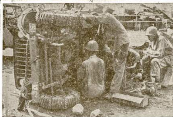
Amerikiečiai kareiviai taiso "susinaravijus" dzyppą Ormeo karo frontė, Leyte saloje. "Džypas" duodasi lengvai apverstai ant šono, kad geriau būtų prieinama jo "viduriai"; netaip kaip sunkus automobilis, po kuriuom mechanikas turi aukštėlninkas atsigulęs

Sakoma, jau pradėjo Švedų chemijos kompanijos gaminti dirbtinį kraujo plazmą. Pranešime žymi, kad galima "dextrane" prigaminti didelius kiekius ir ne aukšta kaina.