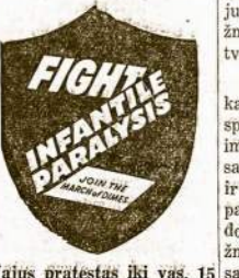
Vajuus pratestas iki vas. 15