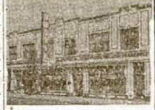
DIDELĖ RAKANDŲ, RADIO IR JEWELRY KRAUTUVĖ JOS. F. BUDRIK INC. 3241 So. Halsted St. Chicago 8, Ill. Tel. CALUMET 7237—4591

BUDRIKŲ RADIO VALANDOS: W. H. F. C. 1420 K. Kętvėgas, 7 valanda vakaro. W. C. F. L. 1000 K. Nėdėlioj 9:30 val. vakaro.