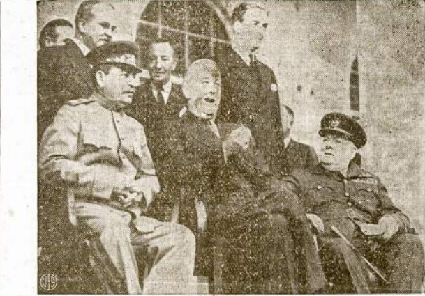
Stalinas, Rooseveltas, Churchillis, su savo pagalbininkais, šiuo tarpu laiko konferencijai, sakoma, Soči mieste, Kaukaze, Sovietų Sąjungoje. Ką jie svarsto, apie tai einą visokių speilijimų, tačiau tikrai niekas nežino. Pati konferencijos vieta taip jau spėjimams.

Amerikos pirmoji armija stengiasis dasigauti iki Reino.