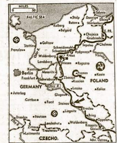
Rytų fronto žemėlapis kaip šis frontas stovėjo apie savaitę atgal. Šiandien Raudonoji Armija netik jau pasiekė Oder upę, bet persikėlė ją keliose vietose. Paskutinės nacių tvirtovės prieš Berlyną, Kustrin ir Frankfurt, jau apsupamos raudonarmiečių. Iš šios vietos iki Berlyno nebėra nei 30 mylių.