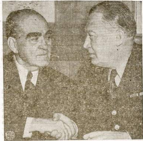
BIG BOSS OF N. Y. YANKEES — At right is Col. Larry S. MacPhail, who heads a three-man syndicate that recently purchased New York Americans ball club, of the American League. He shakes hands with E. G. Barrow, chairman of Americans board, during New York meeting. Yanks and their minor league properties were reported sold for $2,500,000

Though the churches are not heated, the solid pack of humanity soon makes the ice-cold temperature bearable. Snow that we brought on our boots soon begins to melt and every time you kneel down in the slush it makes you think how your pants (or dress) will look tomorrow. And you will kneel down many a time before the ceremonies are over which today, being the birthday of the patron-saint of the local