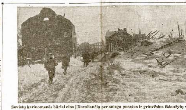
Sovietų kariuomenės būriai eina į Karaliaučių per sniego pusnius ir griuvėsius išdaurytų vokiečių pozicijų ir tvirtovių. Pūgos daug pasunkinę Sovietų kariuomenę pirmynžangą.

Jau dabar visiems turėtų būti aišku, prie ko tai privedė vokiečius. V. Andralis.