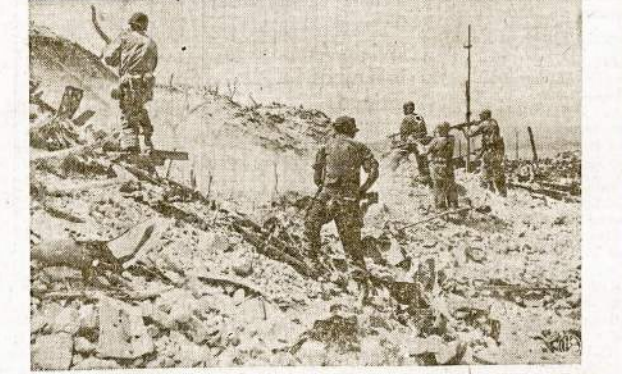
Būrys amerikiečių šaulių medžioja likučius japonų Corregidor saloje, Filipinuose. Ne-laisvėn japonams vyriausybė neleidžia pasi duoti. Dėlio sunku juos buvo iskrapstyti iš slėptuvių.

LONDONAS, kovo 6. — Kubaniaus slėnio aliejaus imonės, kurios buvo nacių išdaudžtos, dabar jau vėl gražiai veikia ir teikia aliejaus Sovietų karo reikalams.