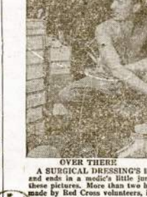
A SURGICAL DRESSING'S life begins in a Red Cross workshop and ends in a medic's little clinic clearing in the Philippines. In these pictures, more than two millions of these dressings have been made by Red Cross volunteers, in all parts of the nation.