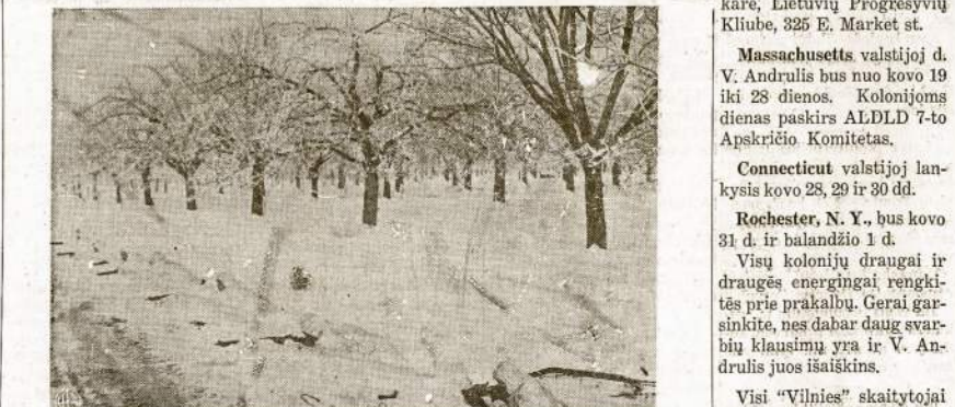
Kaip gerai užsikamoflavę Talkininkų kareiviai žiemos sąlygose, parodo šis atvaizdas, nurauktas netoli Zetten, Olandijoj. Juodi taškai sniegu yra išsikisę karių šautuvai. Gerai įsijūriję iš arti pastebėsite, jog ties kiekvienu šautuvu slepiasi kareivis. Taip pasislėpę jie leidžia naiciams prieiti visai arti, bet nebe grįžti atgal.