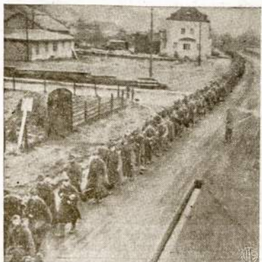
Kiek akys gali užmatyti ilgiausios eilės nacių kareivių maršuoja į vakarus—maršuoja po stropia amerikiečių sargyba ir koncentracijos kempes.