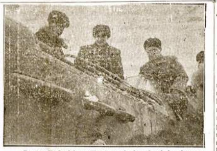
Justas Paleckis apžiūri naują bomberį, kurį savo aukom nupirko evakuavę į kitas Tarybines respubli-kas lietuviai kai Lietuva buvo nacių okupuota.

WASHINGTON, kovo 17.—Šiandien prezidentas su žmona atžymėjo savo 40-tų metų že-nybinio gyvenimo sukaktuvę be jokių ceremonijų. Vien šė-ros nariai turėjo pietus. Roo-seveltai apsidėdė New Yorke, 1905 metais.