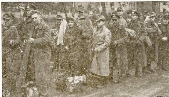
Štai būrys "volksšturmierių" suimty Trier fronte. Stebėtina, kad nelaisvėn pasiduodami nacių kareiviai atsivedė ir savo pačias su vaikais.