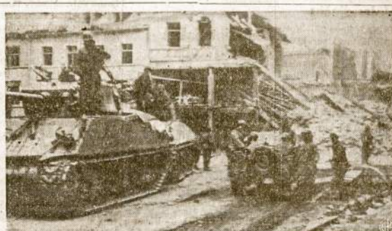
Pora tankų ir "jeep'sas" pravažiuoja ką pirma buvo Hermeskeil miestukas, Vokietijoje. Dabar tik kalnai laužo. Šis vietetas yra dalim 3-sios armijos, 94-tos divizijos, kuri nesulaikomai maršuoja anapus Reino upės.

ju sugyvena su lenkais demokratais. Lenkai demokratai vis labiau stiprėja. Jų pusėje yra tokia galinga organizacija, kaip Lenkų Darbo Taryba, prie kurios priklauso 600,000 lenkų, darbo unijų narių.