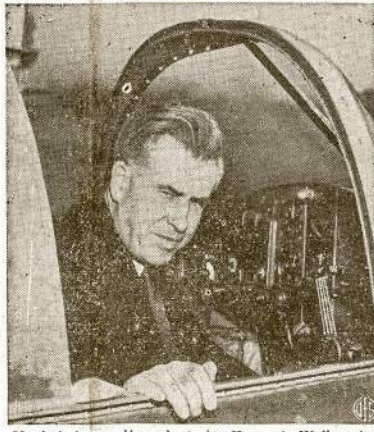
Naujasis komercijos sekretorius Henry A. Wallace jau išmokęs vairuoti orlaivį. Čia jis nufotografotas besėdęs "draiverio sėdynėje." Pirmu kartu pats viešas vairuodamas orlaivį Wallace pasiūlė veltui pavaižinti kelis senatorius, kurie balsavo prieš jo paskyrimą kabinetan. Pasiūlymo senatoriai nepriėmė.

WASHINGTON, bal. 1.—Pradedant su gegužės 1-ma, duonkepiai savo krautuvėse turės iškabinėti lubų kainas kar publikai aiškiai galės matyti.