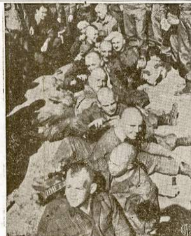
Grupė amerikiečių parašutintinku, kurie nuleisti vokiečių užnagaryj laike mūsų jėgų kėlimosi per Reino upę.

WASHINGTON, bal. 2. — Prezidentas Rooseveltas įvardino 25 genolus, kuriems prašė aukštesnio laipsnio.