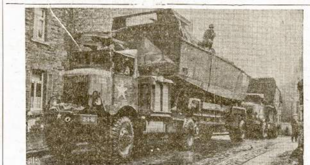
Pirmu kartą karų istorijoj laivynas darė invaziją 200 mylių nuo jūros. Tai buvo invazija Ruhr'o srityn skersai Reino upė. Čia matosi sunkvežimiais gabenami persikėlimo laivai besirengiant invazijai.

LONDONAS, kovo 29.—"The Evening Standard" Lishono keliu gavęs pranešimą, kad Hitleris tikisi už kelių dienų duoti labai "nepaprastą" spycių.