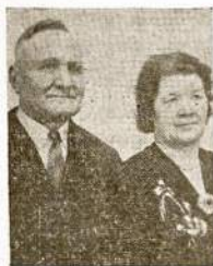
J. ir U. Juodaičiai