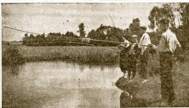
Druskinkait, viena gražių vasarviečių Tarybų Lietuvoje. Smagu meškeroiti gėminės ežere, kada ponas ar vorskūpo pareiģinas nebegurmoja pabaudom.