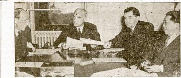
Keturi didžiųjų šalių ambasadoriai valstybės departamente, Washingtono, daro planus dėl Jungtinių Tautų konferencijos, įvyksiančios balandžio 25. Iš kairės į dešinę matote: britų ambasadorių Lord Halifax, U.S. valstybės sekretorius Edward R. Stettinius, Jr., Sovietų ambasadorių Andrei Gromyko ir Kinijos ambasadorių Dr. Wei Tuo-ming.