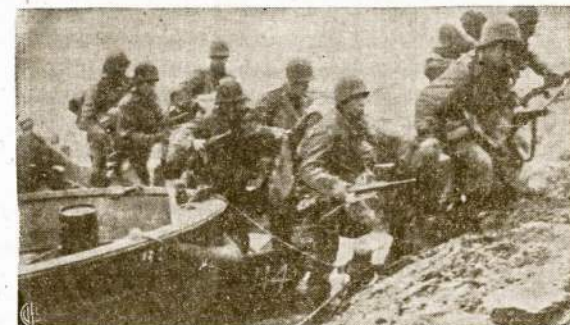
Gen. Patch komanduoja infanterija persikūsi Reino upę nedideliais laivelais atakuojančius naują Vokietijos "sirdyje."