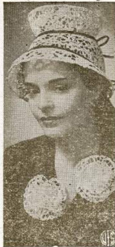
IN LACE —This youthful bonnet is made of white starched lace, with lace pom-poms to go with it. Narrow bands of black velvet ribbon outline the shaped crown and tie in pert bows in back. Laddie Northridge design.