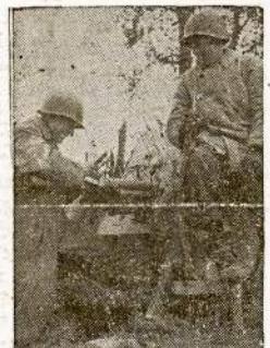
"TELL THE FOLKS back home I'm safe"—An American fighting man at an advanced position in Germany rests on a captured anti-tank gun to send word to his family through a Red Cross field director.

Approximately 350 cigarette packs are made from a pound of tobacco leaf.