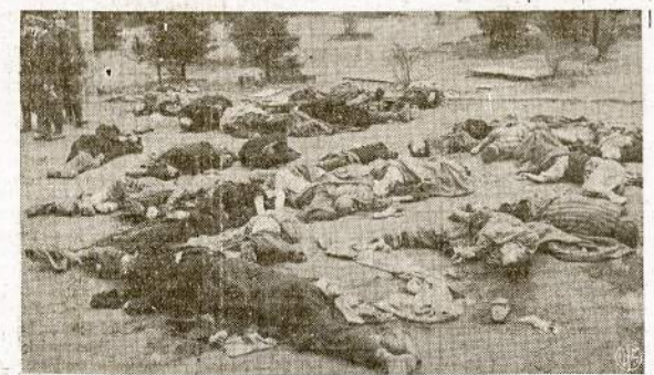
Kruva lavonų, kiekvienas su peršauta galva, atrasti nacių koncentracijos stovykloje ties Gotha, Vokietijoje. Didžiama nužudytyju buvo karo belaisviai, kiti priešvarta atgabenti Vokietijon verstiem darbam iš okupuotų teritorijų.