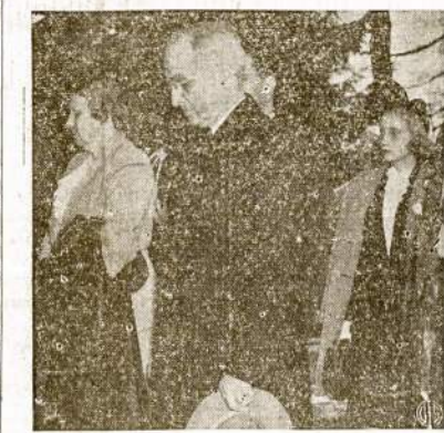
Prezidentas Harry S. Truman, jo žmona ir duktė Margaret, autofotografuoti laike Roosevelto laidotuvų.

WASHINGTONAS, bal. 26.—Prezidentas Trumanas atsisaukė į visus amerikiečius apodinti kuodaugiausiai pergalės darželį.