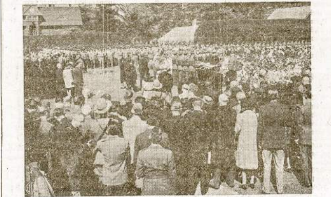
Tik artimais draugai ir valstybės bei armijos aukštai pareigūnai dalyvavo privatinėse laidotuvėse prezidento Roosevelt. Jo palaikai užkasti privatiškame šeimynos kapinyne pui-kiamie gėlių darželyje visi arti Rooseveltų rezidencijos Hyde Park, N. Y.