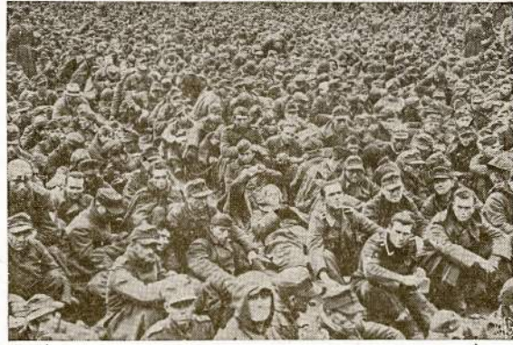
Tik vienos dienos "laimikis" ir tik viename vakarų fronto sektoriuje. Tai maža dalis tą dieną suimtų belaisvių nacių. Visas dešimtys akry gargas taip sausakimiai prikimštas naciai "viršzmogiais" pirma jie išgabenti toliaus nuo mūsų linijos.