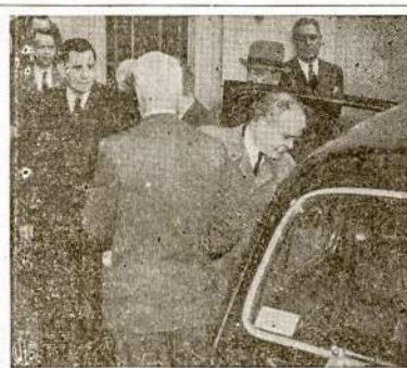
Po pasimatymui su prezidentu Trumanu Sovietų Sąjungos Užsienio Reikalų Komisaras Molotovas sėda į automobilį važiuoti į SSSR Ambasada Washington. Užpakaliu „publika“ stovi mūsų Valstybės Sekretorius Stettinuis.

DENVER, Col.—Aukštasis 14,250 pėdų kalnas dabar vadinamas kalnu Wilson bus užvardintas—Franklin Roosevelt.