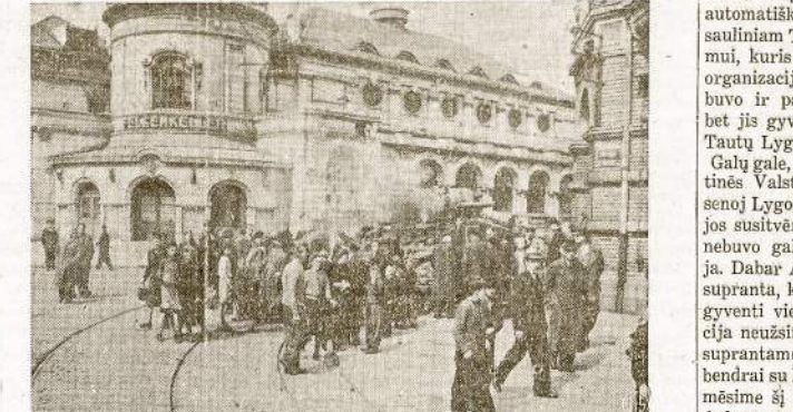
Būrys vokiečių civilių stebi kaip į Leipcigą įmaršuoja amerikiečių jėgos. Priekyje, kur matosi dūmai, įvyko apsisaujimas su nacių likučiais ir šioj vietoj sužalotas vienas mūsų tankas.