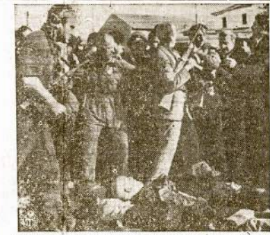
Italijos partizanai suėmė Mussolini ir jo ministerius bėgant į šveicariją, ir po nuteisimo mirlop, susaudytus atgabeno į Milaną ir tūlam laikui paliko miesto alkštė, kad žmonės matyti, jog Mussolinio jau nėra, kaip nėra jo režimo. Paveiksle matyti jo lavonas gulintis alkštė. Partizanai bando sulaukyti minias žmonių, kurie dasigavę iki Mussolinio spiaudė ir spardė jo lavoną.

Prezidento Veto Laimėjo Kongrese WASHINGTONAS, geg. 4.—Prezidentas Truman veto bilij, kuris mierijo duoti defermentus farmų darbininkams. Bilijus buvo abiųjų Kongreso butų sukiltas.