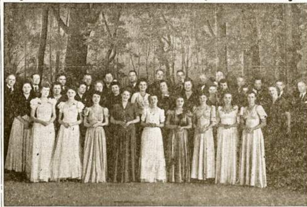
Didysis LKM Choras rytoj ir vėl linksmsins skaitlingą Chicago Lietuvių publiką Lietuvių Auditorijoje. Apart dainų, choras stato ką tik parašytą dviųjų aktų operetišką dramą "PRADINGO VILTIŠ." Stebėdami gabusios LKM Choro lošėjos rytoj "apsiverksite" pamatę, kad "Pradingo Viltis" visų fašistų ir socialistų, kurie tikėjosi su Hitlerio pagelba vėl valdyti Lietuvos laudį. Lošimas prasidės lygiai 4 valandą popiet; nesivėlinkite.

Bet nereikia slėpti, kad hitlerinės veislės esama visur — ne tik Ispanijoje, Portugalijoje, Šveicarijoje, Argentinoje. Jos esama ir šioj šalyje ir Britanijoje. Penktoji kolona toli gražu ne visur suvartyta į bučių. Prie hitlerinių rezervų reikia prikaityti ir lenkų ponstų ir tūlius lietuviškus gajavus.