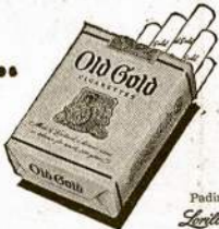
Padirbtai šerlėtas tabako firmos žinomos per 200 metų

Old Golds nėra vilgomi vandeniu iš Jaunystės šaltinio.