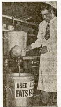
Joe Louis, pasaulinis bokso čempionas, taupo atliekamuos riebalus, kurie taip labai reikalingi daugelio dirbtų produkcijoj. Louis tarpe kumštinių darbuojasi savo valgykloje, New Yorke.