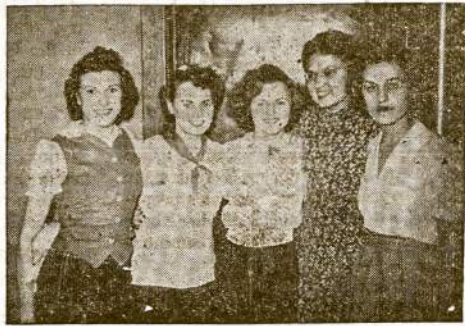
Feminine puleritide. Yep, they're Chicago LDS bowlers.