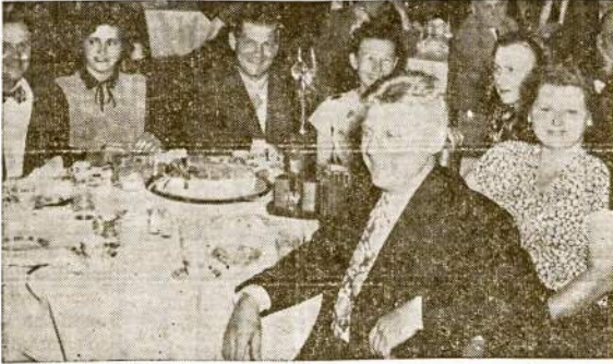
Detroit, Michigan members of the LDS who this weekend are playing host to thirty bowling teams participating in a national tournament sponsored by the organization.