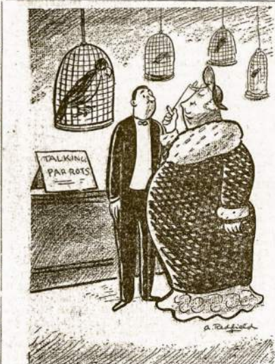
Paukščių pardavėjas: "Ne, ponis bosiene, šią papigą ne pardariau pirkti. Ji ilgą laiką išbuvo pas unjos organizatorių ir būtų labai pavojinga laikyti namuose, kur tiek laug ir būtų samdotė."