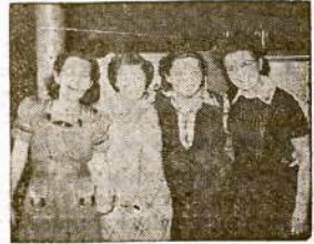
Same girls bowling this weekend?