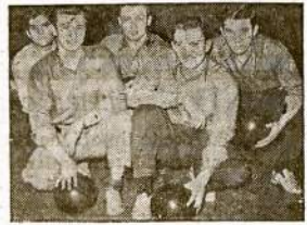
Bringing home the gravy?