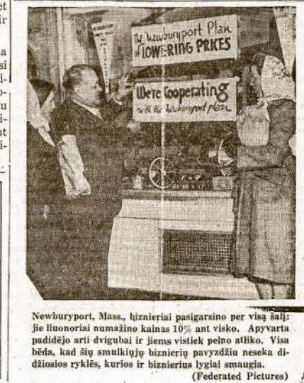
Newburyport, Mass., hįznieriai pasigarsino per visą šalį: jie huonorariai numazino kainas 10% ant visko. Apyvarta padidėjo arti dvigubai ir jiems vistiek pelno atliko. Visa bėda, kad šių smulkųjų biznierių pavzdžiu neseka didžiosios ryklės, kurios ir biznieriūs lygiai smaugia.