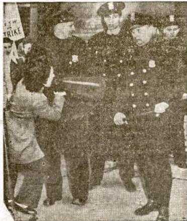
Telefonistė streikerė Detroito negalėdama per policijos kordong pasiekti streiklauzių, per megafoną juos gėdina. Patėmykite vieno "bulians" frizionimį ir kaip pasiruošę skelti streikieri buoze per galvą.