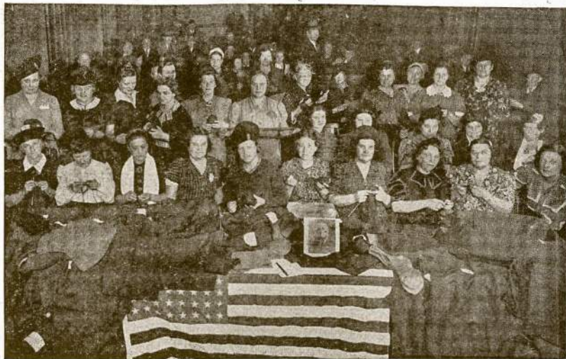
Photo of President Roosevelt surrounded by Lithuanian-American women of Brooklyn, New York who contributed to Red Cross during war against axis powers. In all probability above group will be checked on by House Un-American Committee because they want country to return to peace policy of Roosevelt.

The spirit of youth made Vilnis what it is today. This Sunday at Lithuanian Auditorium it will still be prevalent among the two hundred gathered who will recant experiences and make plans for an even more broader, better newspaper of, by, and for Lithuanian-Americans.