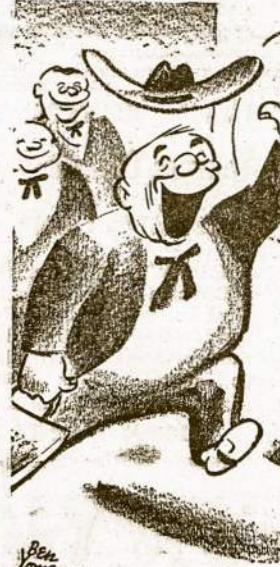
"What this Hartley Bill does to labor is even more than I'd expected."

Groan....groan.... Phyl Uponbeeder did just exactly what the name implies....fill up on beer. Here's the story: