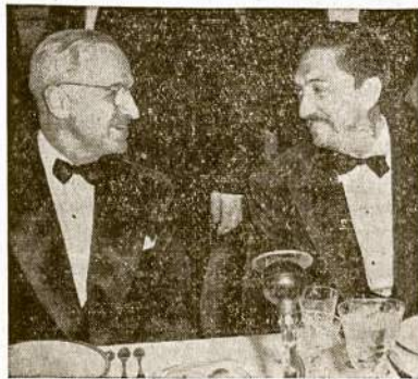
Driejų Amerikos respublikų prezidentai: Harry S. Truman ir Miguel Aleman. Jiedu nusifotografavę kada Meksikos prezidentas kelias dienas atgal lankėsi Washingtono.

Kur čia komunizmas?—jūs klausiate. Nesirūpinkite, Rankinas jį rado. Filmos turinyje įvelti vietiniai politikai, kurie nori to asmens nuiteisimo. Prokuroras eina prieš jų norą ir tokiu būdu išestato tuos politikus negeroje šviesoje. Taigi: politinės mašinos suktybių išskėlimas Rankino akyse yra komunizmas. Dėl visai panašių sumet-