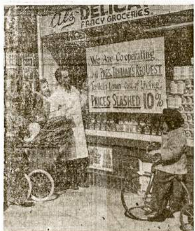
Ir Philadelphiajį vienas smulkus biznieriūs bandė numušti kainas ant maisto produktų 10%, bet greitai apsižiūrėjo, kad stambieji rykliai nei nemano liusnoriai atsakyti bent dalies pelnų. Taigi, prez. Trumano malda-vimas liusnoriai numušti kainas taip ir subliuško.

—Tai kvailas klausimas... Argi jau tu ir tiek dar nežinai, kad tik ta vieta šventa, kurią kunigai pašventina? —Bet jūs sakote, kad žemė pats dievas sutvėrė. Jeigu žemė paties dievo sutvėrta, tai kaip pati žemė, taip ir vandenys savaime paliko šventi nuo paties dievo rankos, ar ne? Tai iš kur jūs, kunigai, gavote tą ekstrą šventenybę, kuri ir už paties