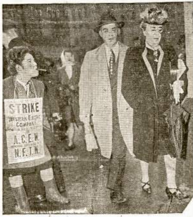
Pikietuojanti telefonistė New Yorke sarmatina porą užveidų, kurie veržiasi pro pikietininkų eiles, kad užimt streikerių vietas ir tuo būdu lauzyt streiką.