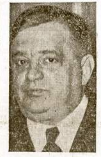
BUVUS New Yorko majoras ir vyriausias UNRRA direktorius Fiorello H. La Guardia šiom dienomis išstojo kovon prieš paskėdinimą panaikinti tuompy kontrole. Kada namų tui labai stokuoja, stambieji savininkai tiesiog aplipėsti nori numininkus, didžiūmoje karo veteranus.

BUENOS AIRES.—Musoliño sūnis Vittorio čia pareiškė, kad jis yra tikras gausiųjų Argentinos pilietybę.