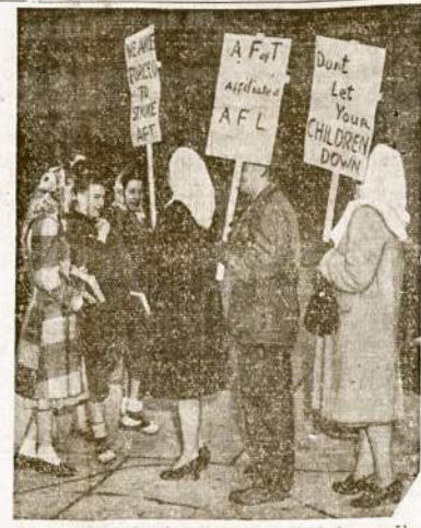
East Detroit mokytojų pikietuoja mokyklų ir perspėja mokinius, kad „šandien pamokų nebus“. Mokytojai sustreikavo po to, kada miesto valdžia atsisakė pakelti algas.

Karalius Grįžo LONDONAS, — Karališkioj šeimna grįžo iš ilgos kelionės po Pietų Afriką. Sutikimas buvo kuklus ir be ceremonijų.