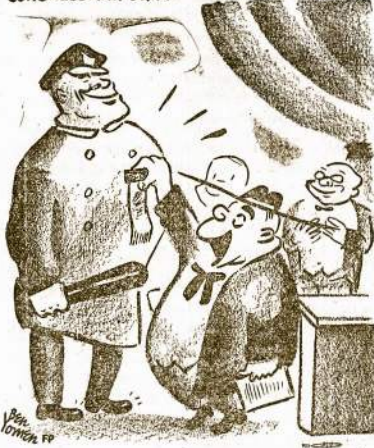
FOR OUTSTANDING HEROISM ON THE PICKET LINE.