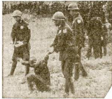
Mirtis Kinijos skerdikui. Šis atvaizdas nutrauktas tuoj po įvykinimo mirties hausmės Japonų generolui Hisao Tani, kuris 1937 metais komandavo užpuolimą ant Nankingo ir surisė dar sviete negirdėtas skerdynes. Tani nubasutas mirties hausme Kidijos karinio tribunolo.