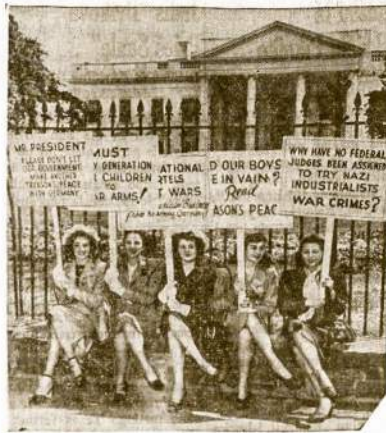
“Būsimoji našlė” piketuoją Baltuosius Rūmus Washingtono reikalaujamos, kad mūsų vyriausybės būtų didžiausias pastangas atsteigimui pastovios taikos pasaulyje, kad joms nebereikėtų likti karo našlėms. Jos visos yra New Yorko Kolegijos studentės.

Illinois Commerce Commission buvo išdavęs įteisintą leidimą.