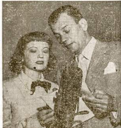
Radioj artistai Helen Claire ir Joseph Cotten agituoja oro bangomis Amerikos piliiečius kovoti, kad prezidentas vetuotų Kongrese perleiktą bilij ardymui darbo unijai.

Iš Amerikos laukiama bent tūkstančio delegatų, iš Britanijos penkių šimtų.